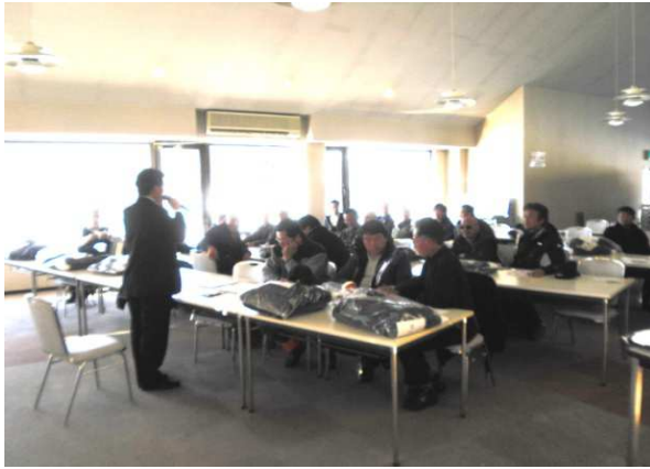
12月冬季索道係員講習会