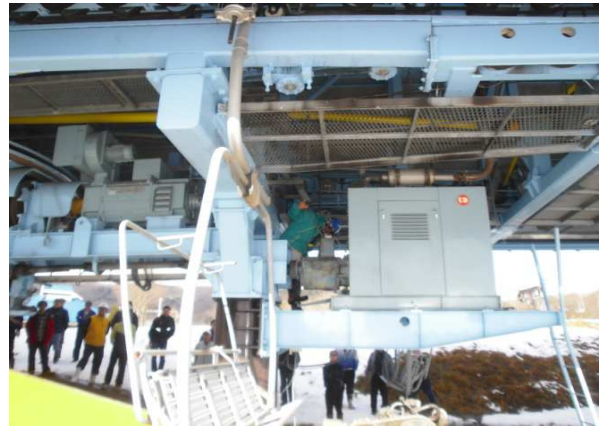
12月予備エンジン操作訓練