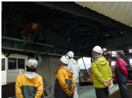
【7月予備原動エンジン講習】