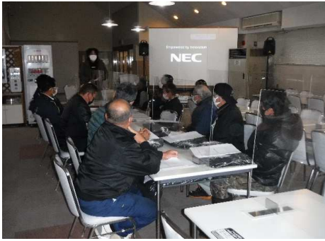
【12月冬季索道係員講習会】

令和3年7月9日 緊急時を想定した救助訓練・予備原動エンジン講習を実施しました。