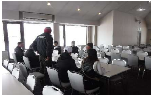
【12月冬季索道係員講習会】

令和6年7月5日 緊急時を想定した救助訓練・予備原動エンジン講習を実施しました。