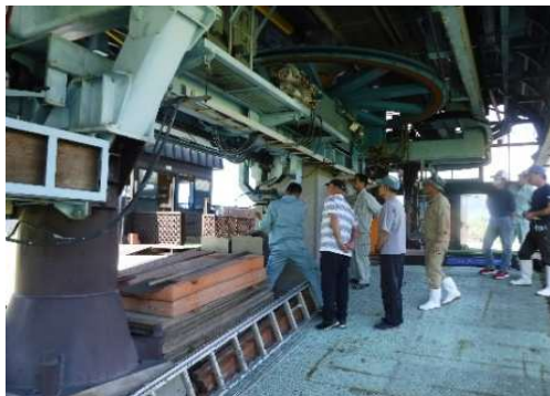
【7月予備原動エンジン講習】